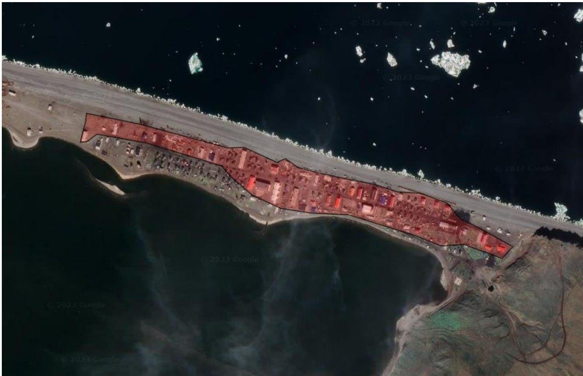
Рис. 2 – Зона действия котельной с. Уэлен.